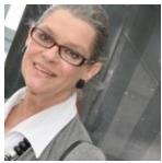
Actrița Irina Petrescu a murit la Spitalul Elias

Adresa de email nu va fi făcută publică. Câmpuri obligatorii *