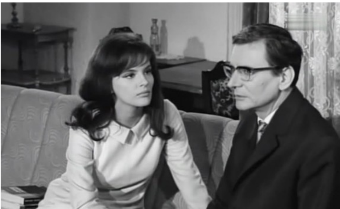
Șeful sectorului suflete, cu Irina Petrescu și Radu Beligan

Rolul cel mai frumos și mai însemnat, cum spunea, pe care l-a ratat ca femeie a fost, a mărturisit cu părere de rău, să aibă o familie. „Teatrul e teribil de posesiv. Dacă l-ai păcălit o dată, te-a abandonat. Eu mi-am ratat o viață de familie. Sau, poate, nu am fost făcută pentru o viață de familie. Nu știu. Sunt momente în care regret că nu am avut copii. Dar apoi îmi spun că așa a fost să fie.”