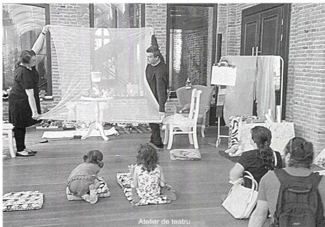
Atelier de teatru

întregii familii în jurul jucăriilor și teatrului, oferind un mic spectacol cu păpuși-jucării, cât și un cadru de construire a păpușilor de teatru.