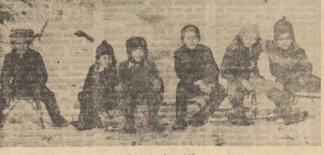
Prieteni... de-a viață