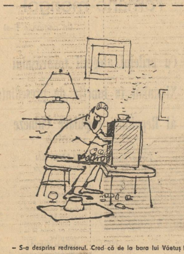
S-a desprins redresorul. Cred că de la bara lui Văetuș!