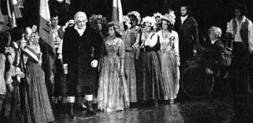
Scenă din Danton de Camil Petrescu la TN București, în regia lui Horea Popescu (1975)