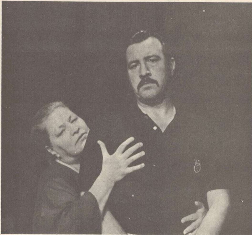
Draga Olteanu și Costel Constantin