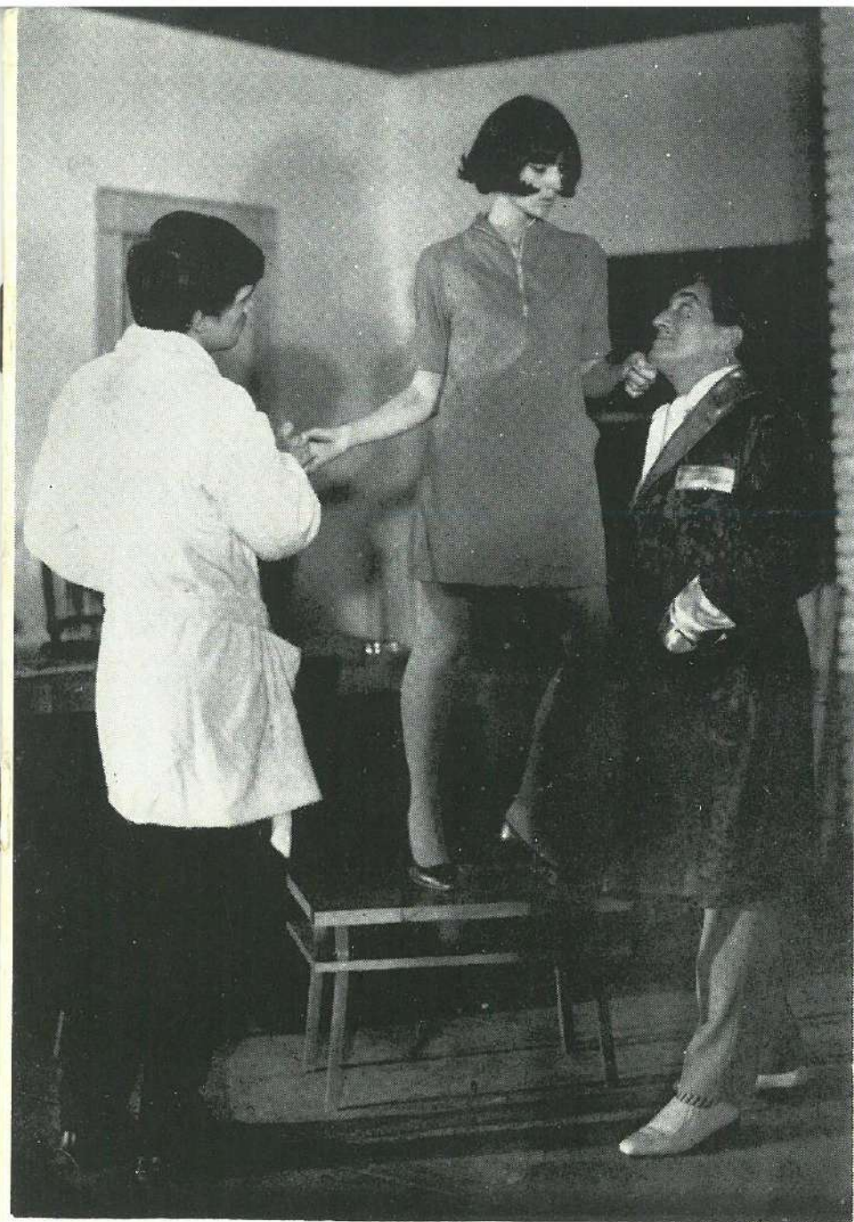
Cînd luna e albastră