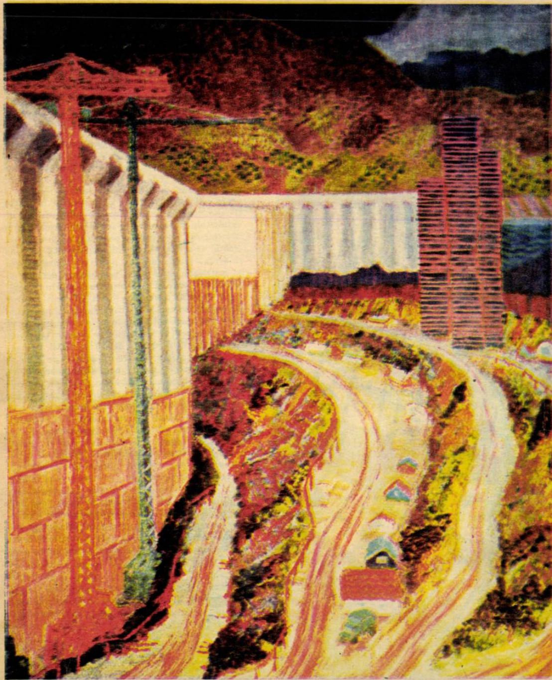
Brăduț Covaliu — RAFINĂRIE